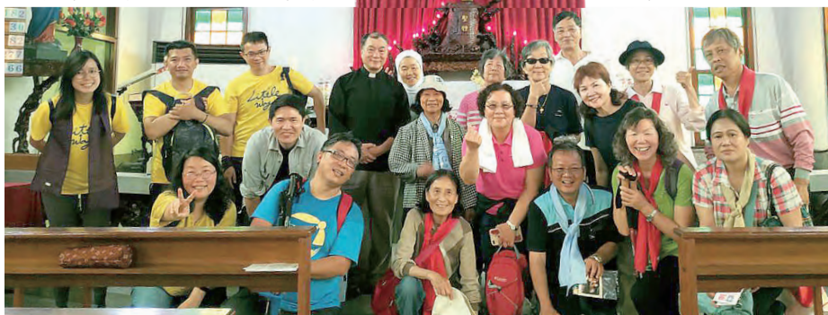
▲新竹關西耶穌聖心堂朝聖隊伍，於坪林玫瑰聖母堂內歡喜留下尋聖足跡。