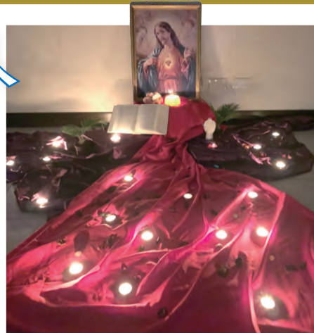
▲極具巧思及富含意境的祈禱空間，引人沉思靜禱。

先說說自己雖然以前都有參加過YCS的活動，但始終缺乏主動積極參加的動力！往往都是別人邀約下才參加，就連教堂也是好幾年沒