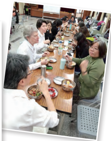
▲輕鬆自在的餐敘共融，美味加分，更增進情感。