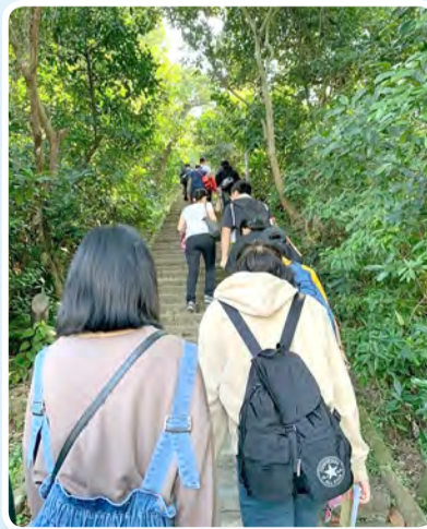
▲象山半日輕旅，離開舒適圈，細看天主創造的萬物。

第4天營隊的活動進入到尾聲了，大家互相擁抱著，也互相交換聯絡方式，期待著下次營隊還可以看到彼此！這次營隊不受到疫情的影響，繼續舉辦著培訓活動，真的是要感謝天主，已經開始期待下一次營隊邀請了！