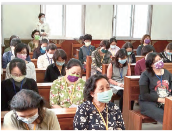
▲靜默祈禱中，徜徉在與天主相遇的安詳與美好。

親密交往／在聖言中／在每天的意識省察中／重新凝視／重新關注／和天主再次相遇／走向永恆／在生命中擁抱耶穌／珍惜每一個和天主來往的生命過程／在盼望中走向預許的永恆