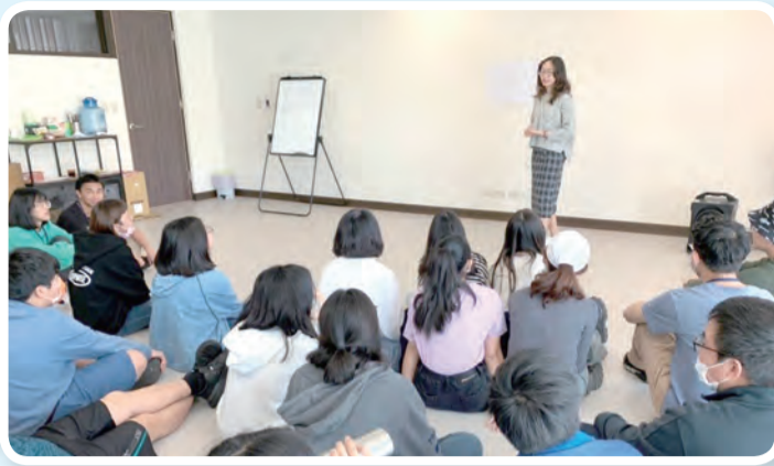
▲講師深入淺出的帶領課程，學員個個如獲至寶。