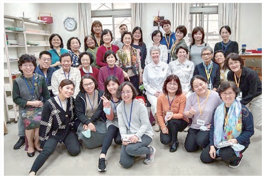
▲教理推廣中心團隊和參與的主日學老師們留下珍貴紀念

在自己祈禱的1個小時裡，我很自然地走到了聖家堂的側面鐘塔，在聖母像前祈禱，再循著小路走到側門。這是童年父親帶著我們兄弟兩人的回家路徑，好自然、好熟悉。我很幸運有著父親的帶領，默默地在我心中鋪好了向天主親近的路徑。我也向天主祈禱，請天主保佑，讓我盡好主日學老師的責任，默默地、堅強地站在孩子的身旁，陪伴著成長。