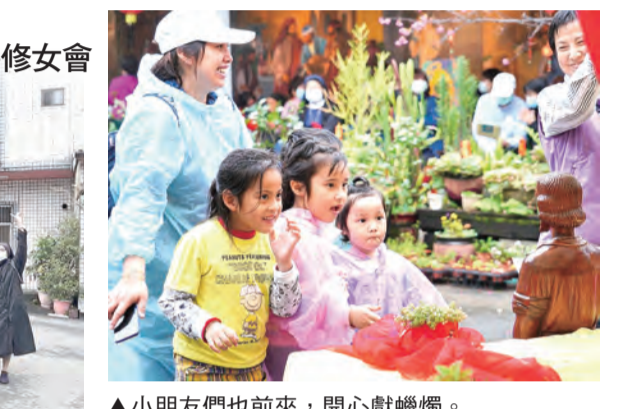
▲小朋友們也前來，開心獻蠟燭。

內灣天主堂充滿熱情與歡笑，絲絲小雨使景色在山霧迷濛中更顯清新脫俗。讚美天主！感謝天主！主俯聽了我們的祈禱！輕輕柔柔悅耳的聖歌播放天主的愛，沉浸在祂身心靈舒暢；當朝聖教友陸續抵達時，受到熱烈歡呼歡迎！在朝聖打