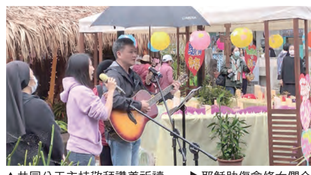
▲共同分工主持敬拜讚美祈禱 ▶耶穌肋傷修女們合影