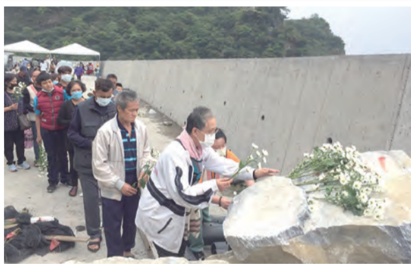
▲長長的隊伍奉獻白菊，為罹難者虔心祈禱。

復活節第三主日，於事故現場，以天主教感恩聖祭的舉行，為聖週五太魯閣號408次車意外罹難與受傷的弟兄姊妹祈禱祈禱。