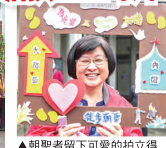
▲朝聖者留下可愛的拍立得照片作紀念。

遊，帶領我們出發邁向目的地「內灣」。走著走著羊群們竟然走入了羅媽媽的店，有些羊迫不及待買起菜包吃了起來（天主不會讓祂的羊餓著）！回歸環山朝聖路，一路看著遠處飄著的雲霧，近處聞著柚子花香，我們開始念玫瑰經的光榮五端，一路走到叉路口，一條要往上爬，成功的話可獲得第4站蓋印一枚；另一條車子多過橋，平步青雲直達內灣，但得失去蓋印機會。我們幾隻羊，因為膝蓋問題選擇後者，也一路走進人聲鼎沸的內灣天主堂。