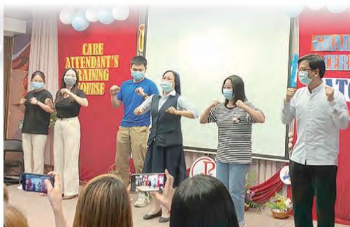
▲越南籍神父、修女及志工們跳舞同樂。