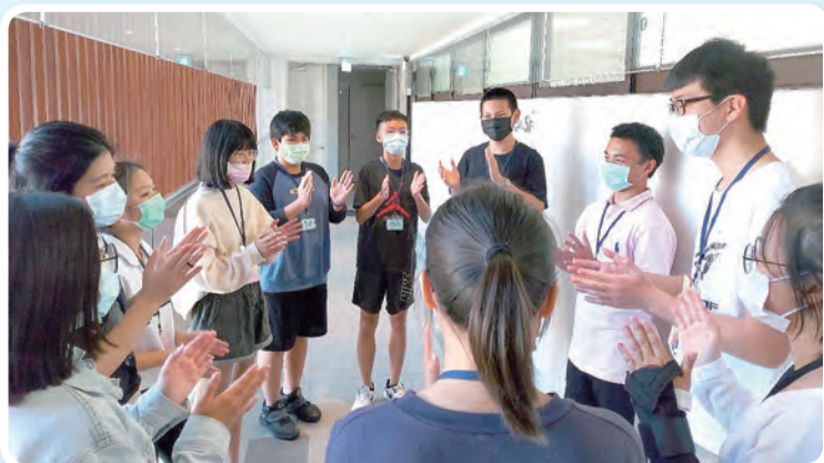
▲小組團康，在遊戲時也能體會團隊合作的重要性。