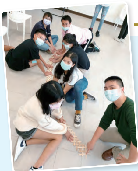
▲體驗教育課程，小組成員開心地展示嘔心瀝血的創意成品。