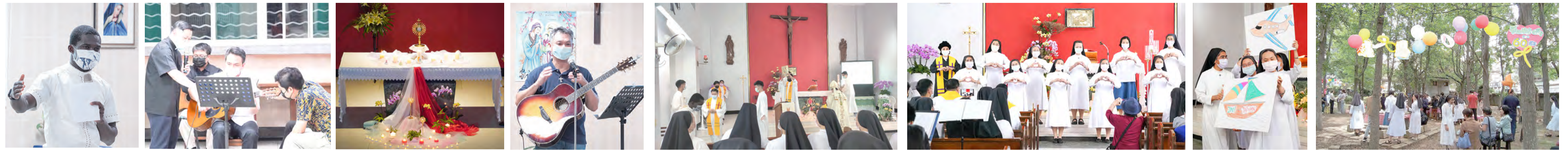
▲4月28日杜貴仁神父聖日分享 ▲三日敬禮音樂會，神父們以唱歌作分享。 ▲4月29日明供聖體為受苦的人祈禱 ▲沈祺琳弟兄分享聖若瑟與家庭 ▲耶穌肋傷修女會歡慶來台60年，隆重舉行感恩彌撒。 ▲修女們在會慶活動中載歌載舞，展現多才多藝的活潑面。 ▲修女們表演會祖的故事 ▲5月1日會慶感恩彌撒後，在楓樹林中的歡樂慶宴。

耶穌肋傷修女會今年慶祝來台60周年的紀念，特別於5月1日上午，恭請新竹教區李克勉主教主禮感恩聖祭，修女們服務與所屬的堂區神父、耶穌肋傷平信徒聯會及修女家人、恩人們共聚一堂，歌頌讚美天主的無限慈愛，感謝天主賞賜修會在台一甲子的無數恩典。彌撒中的奉獻禮，由越南與印尼修女踏著輕快的小舞步，獻上象徵愛情的玫瑰花、光照黑暗的蠟燭，以及即將成為基督體血的餅酒。