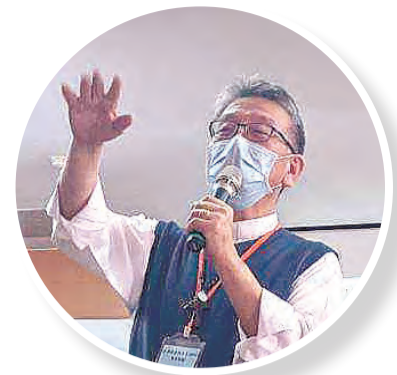
◀▲台南教區李若望主教大力呼籲，教區上下齊心，拓展福傳偉業。