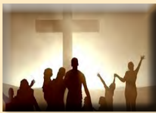
堂區走向社區，準備好了嗎？