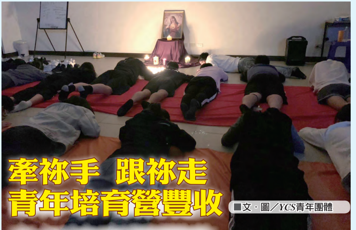
▲第2天晚上的祈禱會，服務員帶領學員們，體會聖道明的伏地祈禱。

我覺得自己逐漸失去教友該有的樣子。經過這次的營隊，我的隊友都很善良、有禮貌、有才華，他們在彌撒時十分專心，聽神父在講道時，很多道理都淺顯易懂，使我容易理解、吸收，我才知道原來我也可以在這個年紀就成為一位很好的基督徒。還記得祈禱會