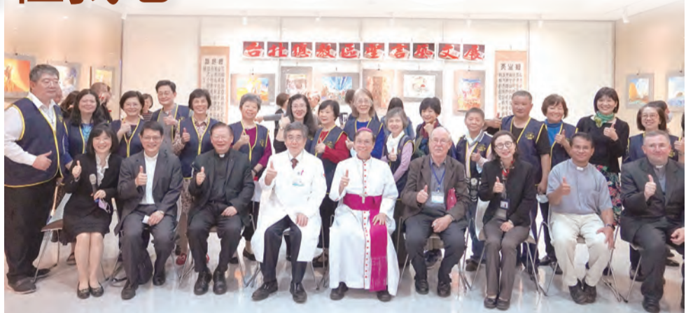
▲聖言藝文參展作品4月15日在輔大醫院公益人文空間舉行頒獎典禮，理事及志工們合影留念。

天主創造男和女，原使他們互相依存，成為一體、生育繁殖、充滿大地，進而治理大地，但因著原祖亞當和夏娃的原罪，與當今世界充