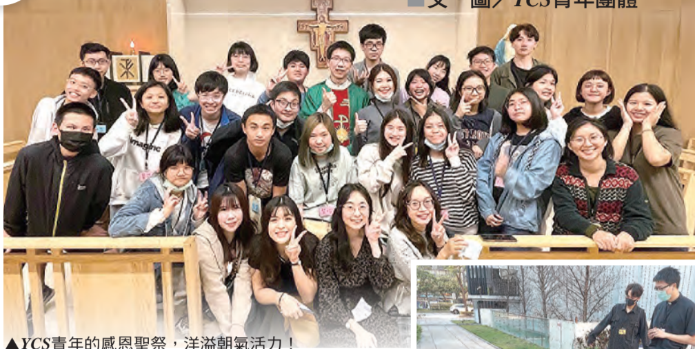
▲YCS青年的感恩聖祭，洋溢朝氣活力！

帶給更多人，我們不定期於寒暑假舉辦營隊、於學期間亦不定期舉辦活動、培育。以下分享參與國際會議及營隊服務的感動與收穫。