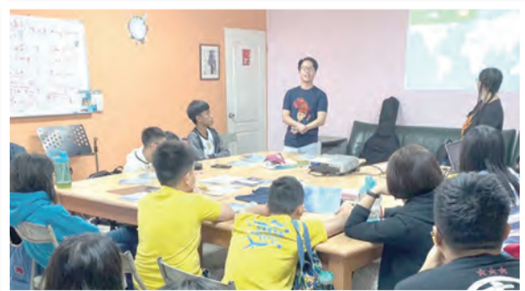
▲世界會議青年代表至新莊聖保祿天主堂青年會分享 ▶戶外共融活動，增進彼此感情，凝聚美好回憶。

YCS台灣青年代表參與國際天主教中學生聯會的國際會議、區域會議等，與國際接軌討論各式議題，並派代表將於國際會議中討論的各項議題所達成的共識內容，提至聯合國教科文組織 (UNESCO) 發聲；在國內，為培育主動關懷、付出給予溫暖、以尊重生命的價值成為具有行動力的基督徒，並將觀察、反省、行動